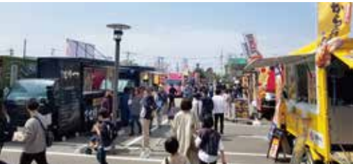
キッチンカー広場